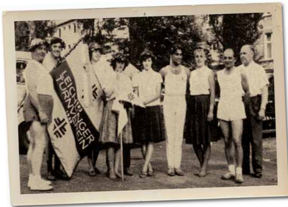
Bild: Heimkehr vom Deutschen Turnfest 1963 in Essen.