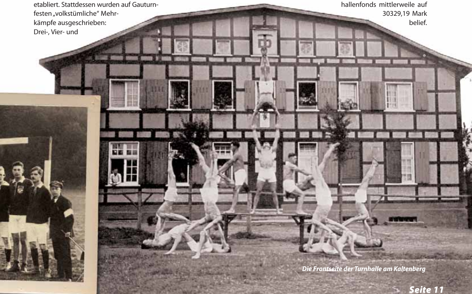
Die Frontseite der Turnhalle am Kaltenberg

Nachdem 1920 die Fußballabteilung entstand, wurde 1921 beschlossen, dem Verein eine Alters- und Schwimmabteilung anzugliedern, 1922 erfuhren die LTV Mitglieder, dass sich die Summe des Turnhallenfonds mittlerweile auf 30329,19 Mark belief.