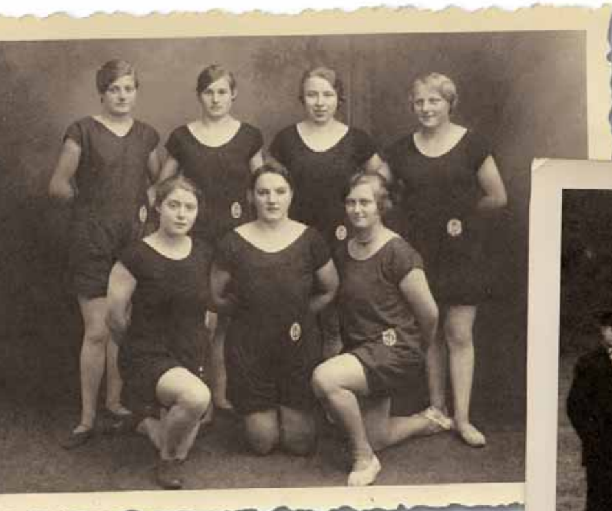
Bild oben: Turnerinnen-Riege des LTV am Ende der 20er Jahre Bild rechts: 1920 als Geburtsjahr der Fußballabteilung im LTV

Zur damaligen Zeit trainierten die Turner im Winter in einem mit 10 Grad Celsius „beheizten“ Raum, als Lichtquelle dienten zwei 100-kerzige Lampen. Für die Kreisjugendfeste, die auf dem Opladener Birkenberg ausgetragen wurden, übten die Turner des LTV aufgrund nicht vorhandener Bahn die 100-Meter-Strecke auf der Straße und erst auf der Laufbahn des Sportplatzes Birkenberg konnten sie ihre